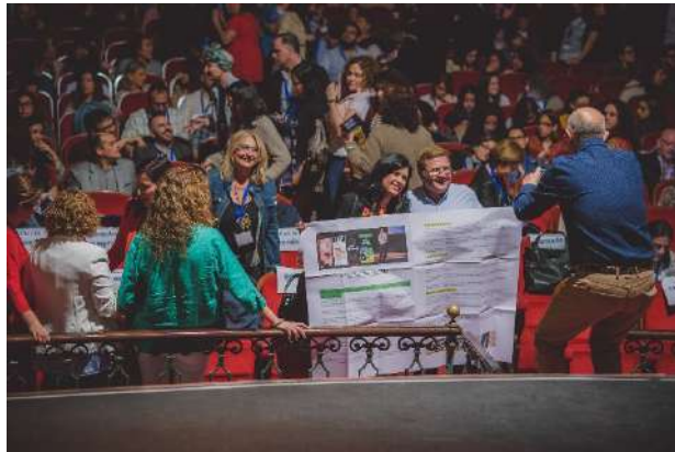
Algunos recuerdos del #EKHuelva18