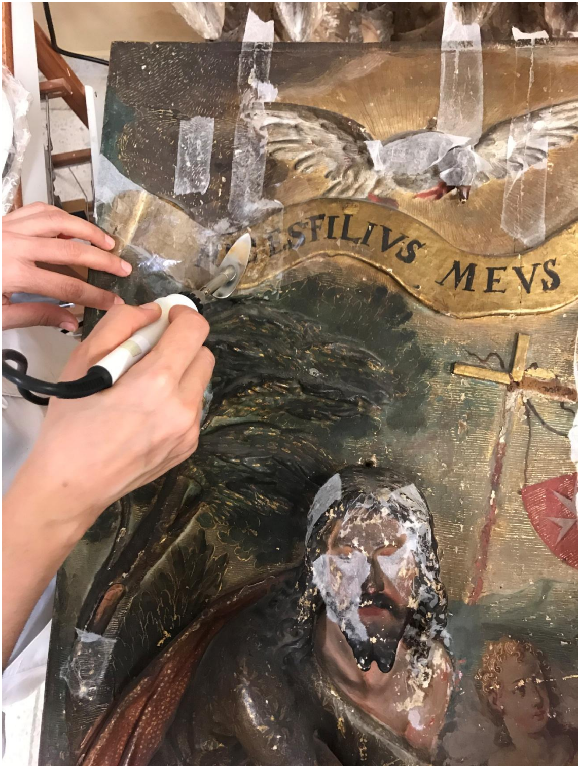
Fijación de los estratos con peligro de desprendimiento