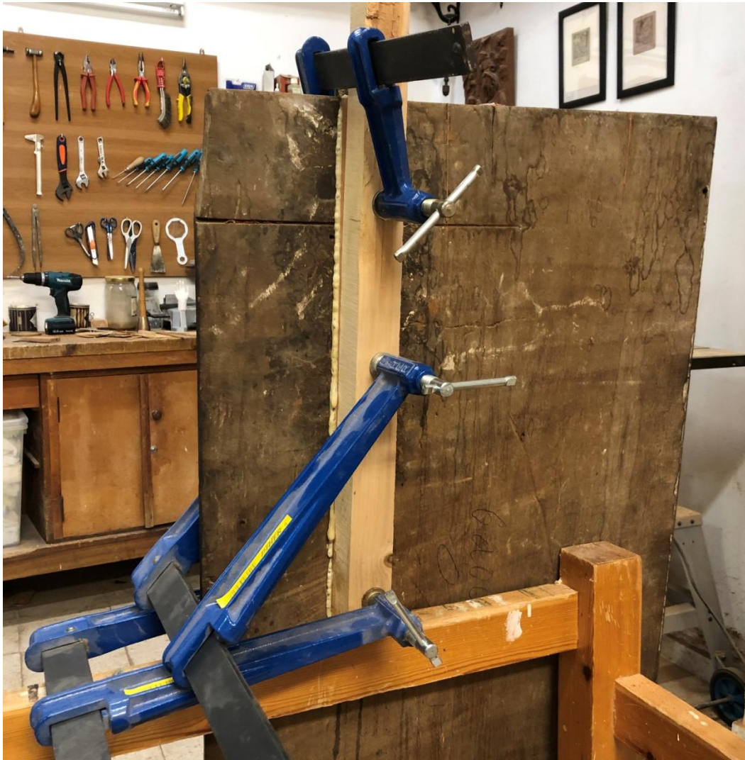
Consolidación y refuerzo de la estructura.