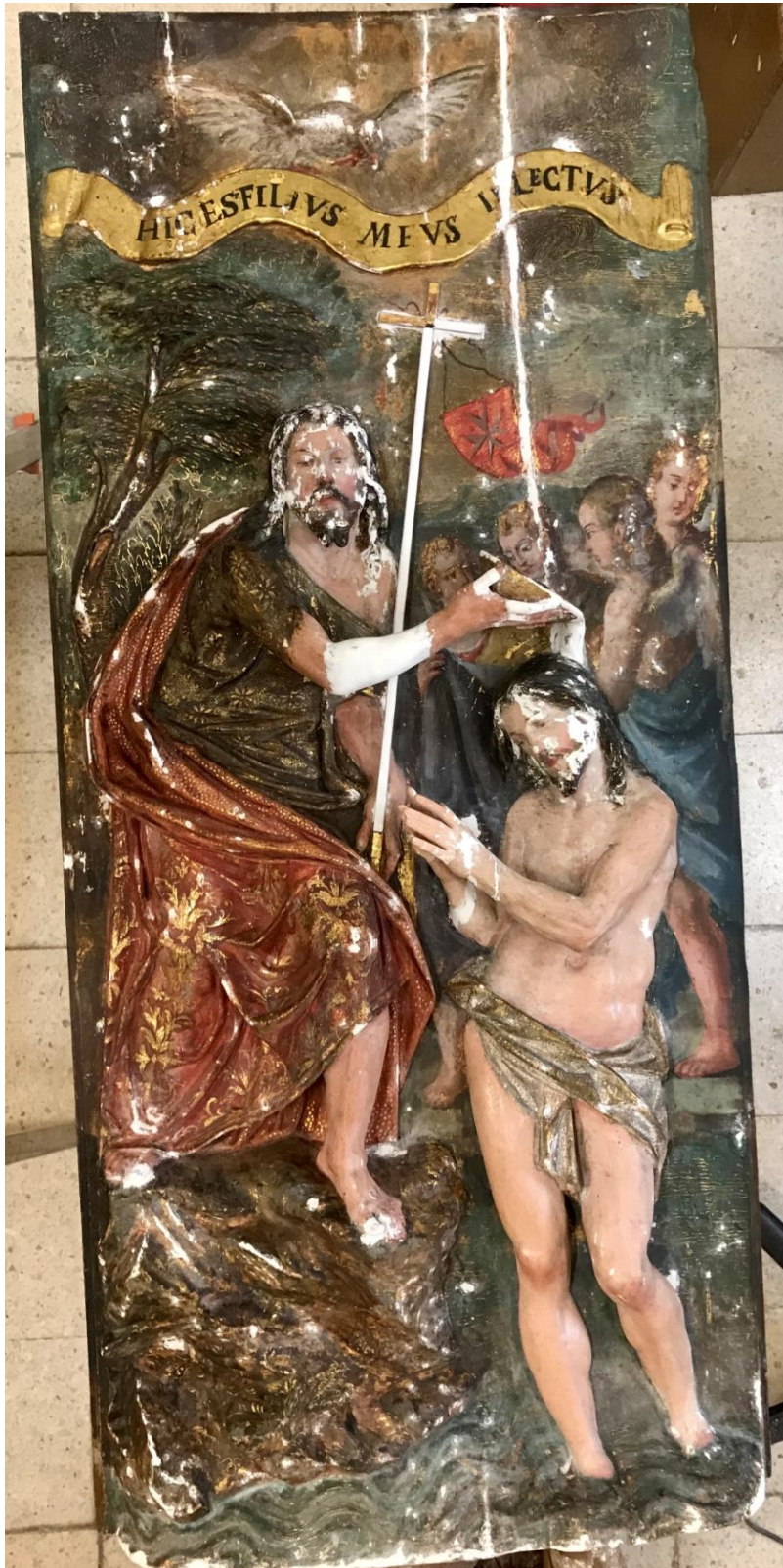
Estucado de las lagunas de policromía.