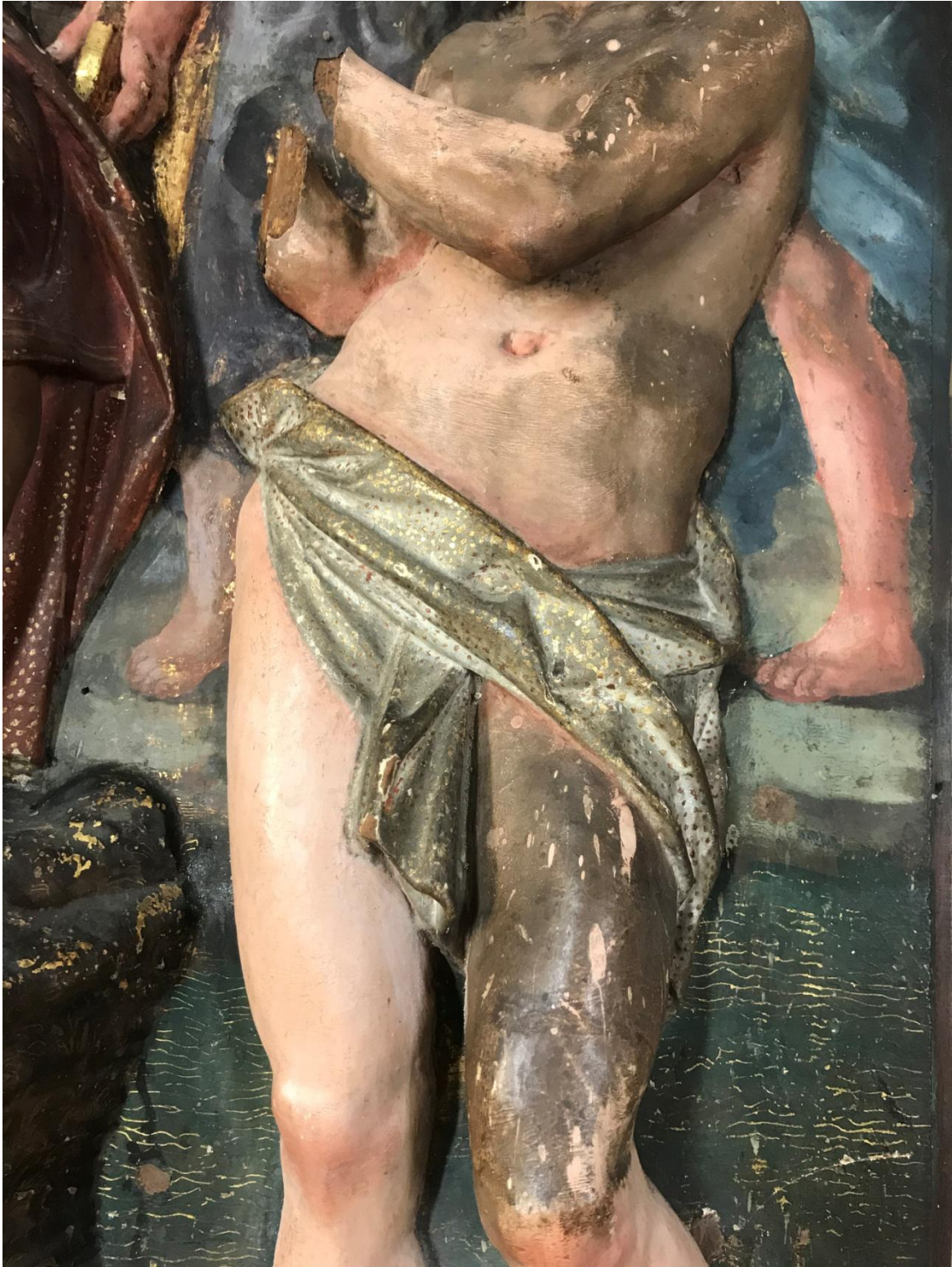
Proceso de limpieza de la policromía.