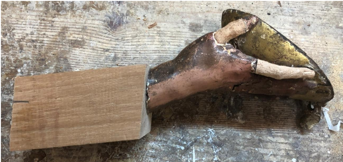
Realización de fragmentos perdidos.