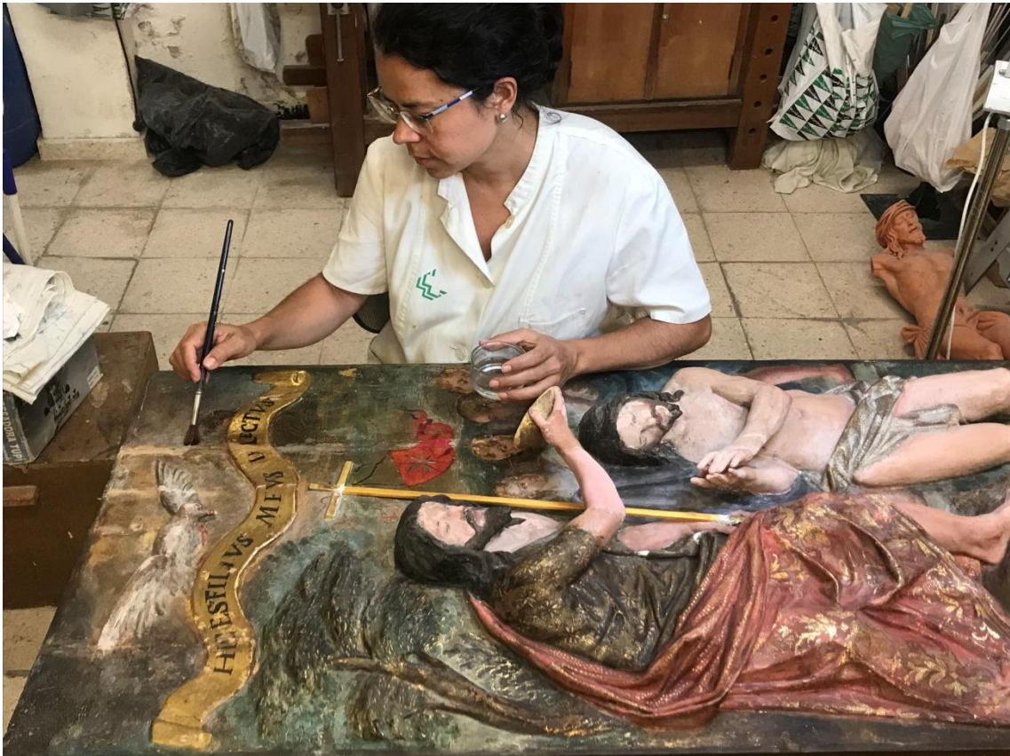
Barnizado de la obra previo a la reintegración cromática con pigmentos al barniz.