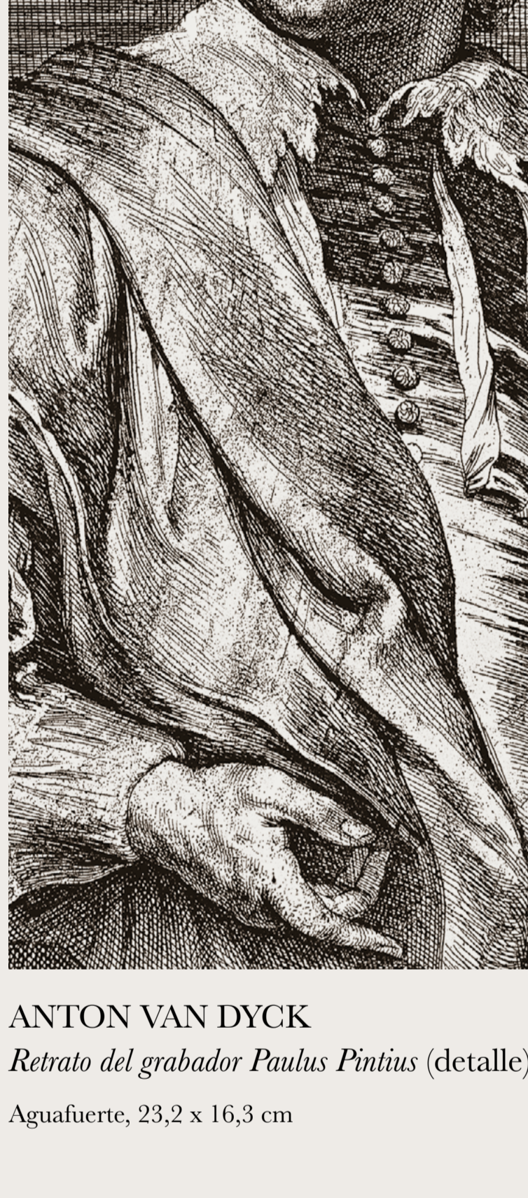
ANTON VAN DYCK Retrato del grabador Paulus Pintius