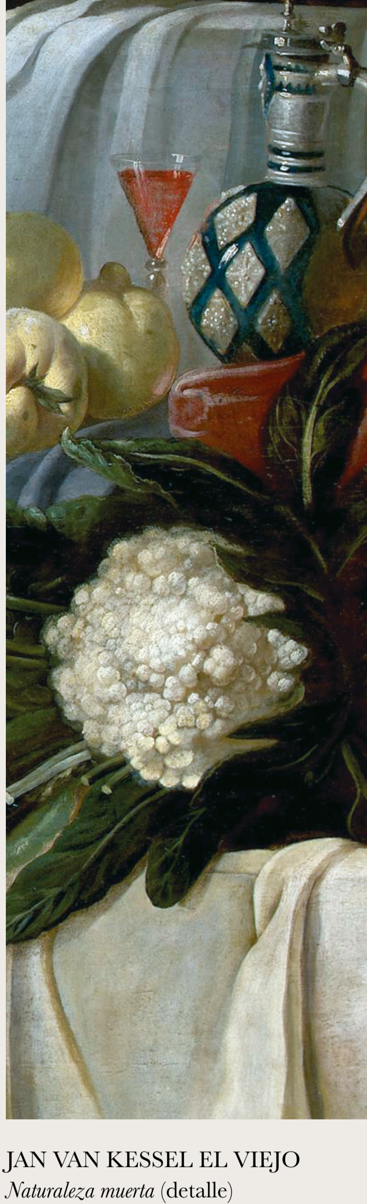
JAN VAN KESSEL EL VIEJO Naturaleza muerta