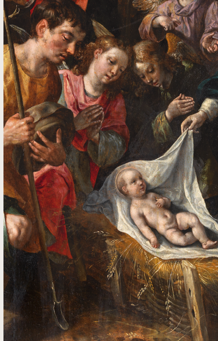
MARTIN VOS Adoración de los ángeles y los pastores

Lunes a sábados de 11:00 a 14:00 h. y de 16:00 a 18:00 h.