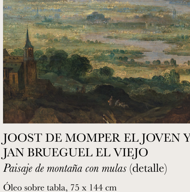
JOOST DE MOMPER EL JOVEN Y JAN BRUEGUEL EL VIEJO Paisaje de montaña con mulas