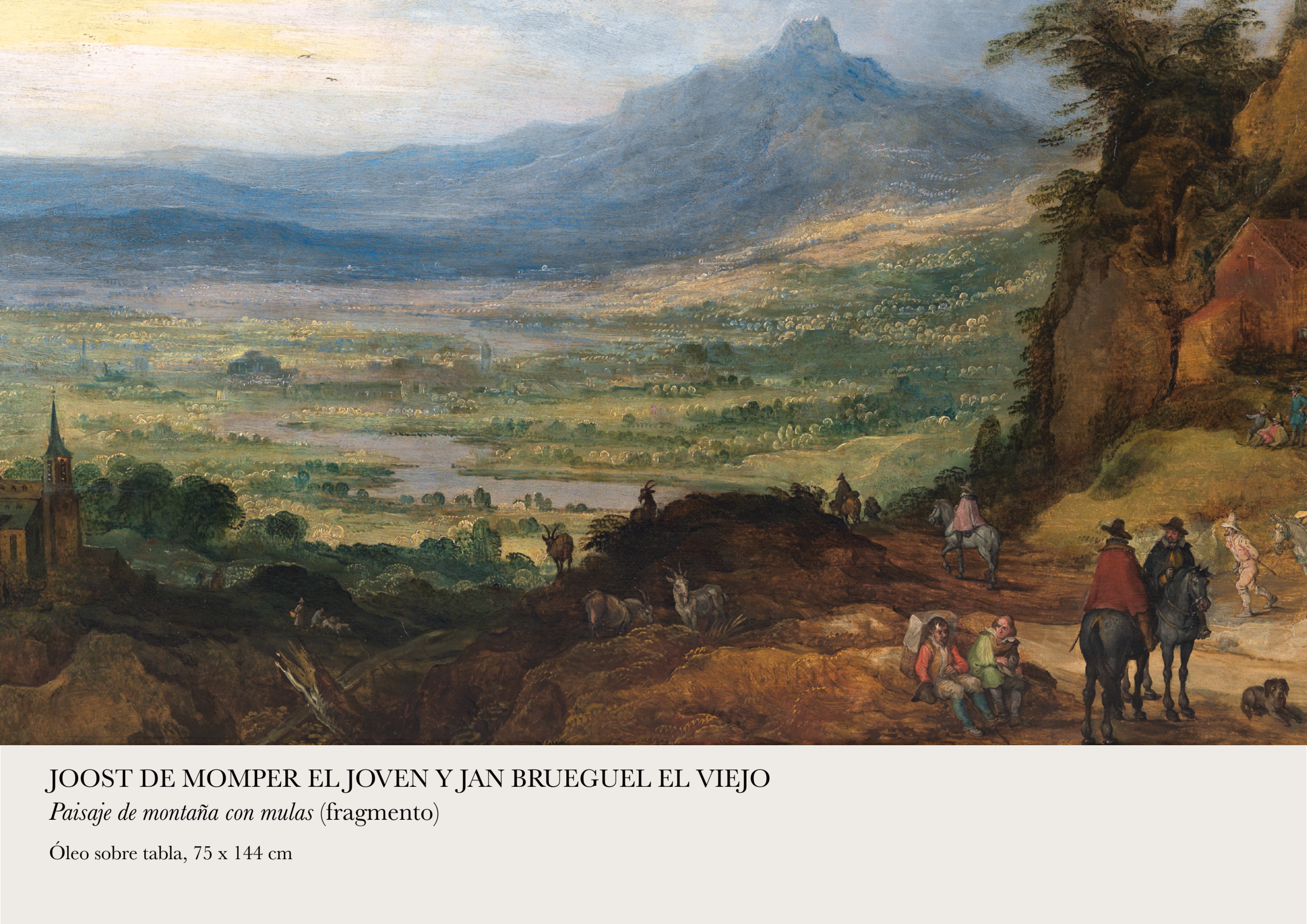
JOOST DE MOMPER EL JOVEN Y JAN BRUEGUEL EL VIEJO Paisaje de montaña con mulas (fragmento)

La pintura flamenca en la Colección Gerstenmaier