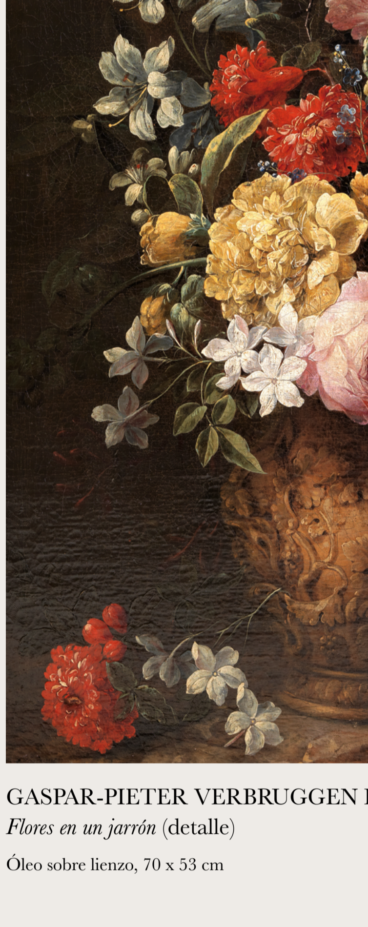
GASPAR-PIETER VERBRUGGEN I Flores en un jarrón