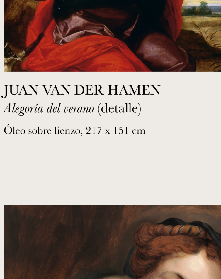
JUAN VAN DER HAMEN Alegoría del verano