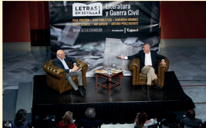
Ciclo "Letras en Sevilla" de la Fundación Cajasol, en el patio, con Arturo Pérez-Reverte.