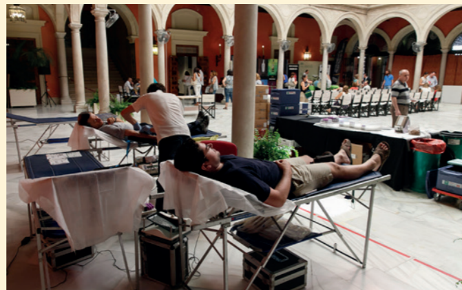
Maratón de donación de sangre en el patio de la Fundación Cajasol en Sevilla.