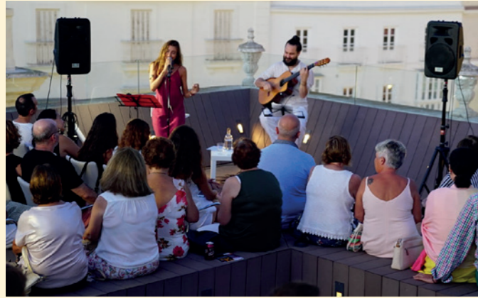
Ciclo de Conciertos "Noches en la Azotea" de la Fundación Cajasol en Cádiz.