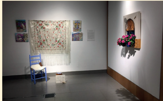
I Exposición "El Arte y los Patios Cordobeses" en la Sede de la Fundación Cajasol en Córdoba.