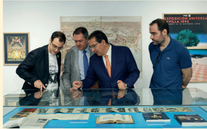
Exposición "¿Éramos tan modernos?"; en la Sala Murillo de la Fundación Cajasol en Sevilla.