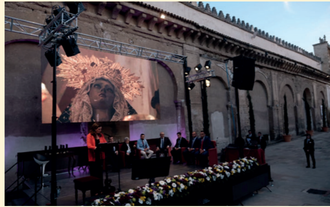
Entrega de los Premios 'Gota a Gota de Pasión en Córdoba 2019' en la Mezquita-Catedral de Córdoba. Fundación Cajasol Córdoba.