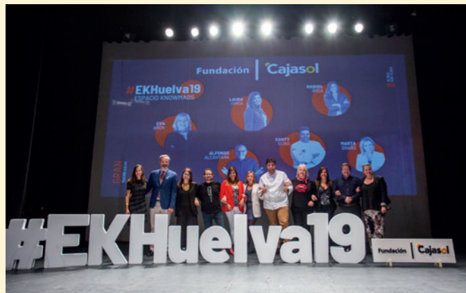
Evento 'Espacio Knowmads 2019' en el Gran Teatro de Huelva. Fundación Cajasol Huelva.