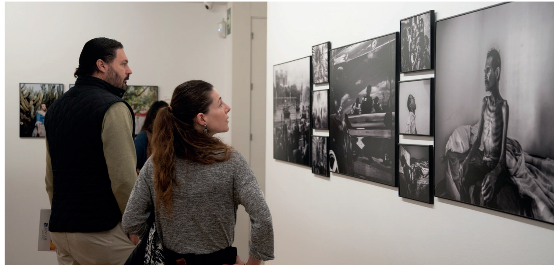
Izquierda Los mejores fotografías del año se muestran en esta exposición.