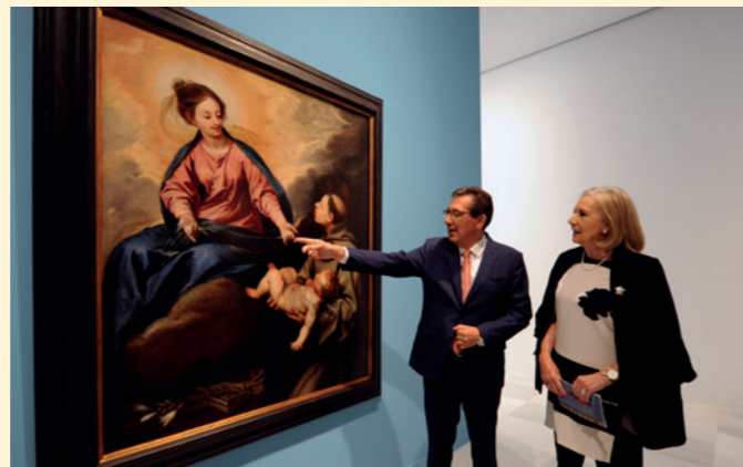
Exposición 'El Barroco en la Fundación Cajasol', Centro Cultural Memoria de Andalucía, en Granada.