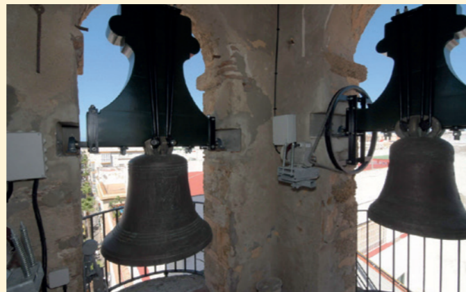
Restauración de las campanas de La Palma en Cádiz. Fundación Cajasol Cádiz.