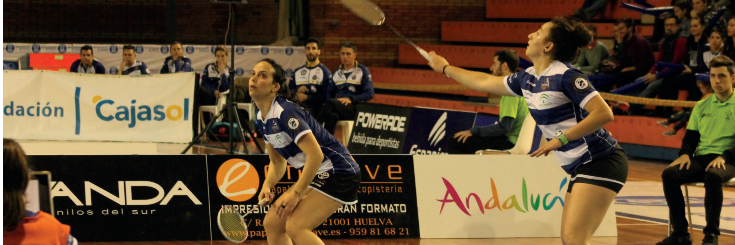
Imagen superior El IES La Orden es uno de los mejores equipos de España por méritos propios.

Inferior derecha Muchos de los máximos representantes del club han sido canteranos de la Entidad.