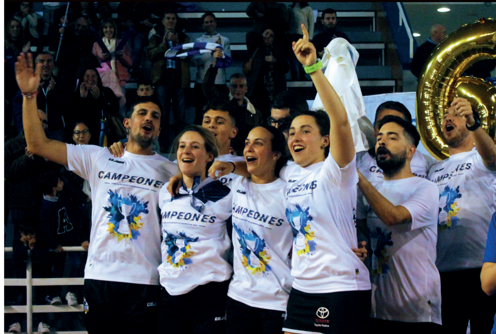
Los integrantes del primer equipo celebran uno de sus últimos títulos logrados.