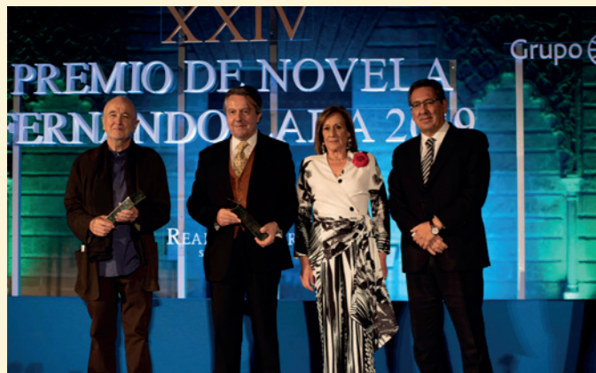
Gala XXIV Premio de Novela Fernando Lara, Reales Alcázares de Sevilla. Fundación Cajasol Sevilla.