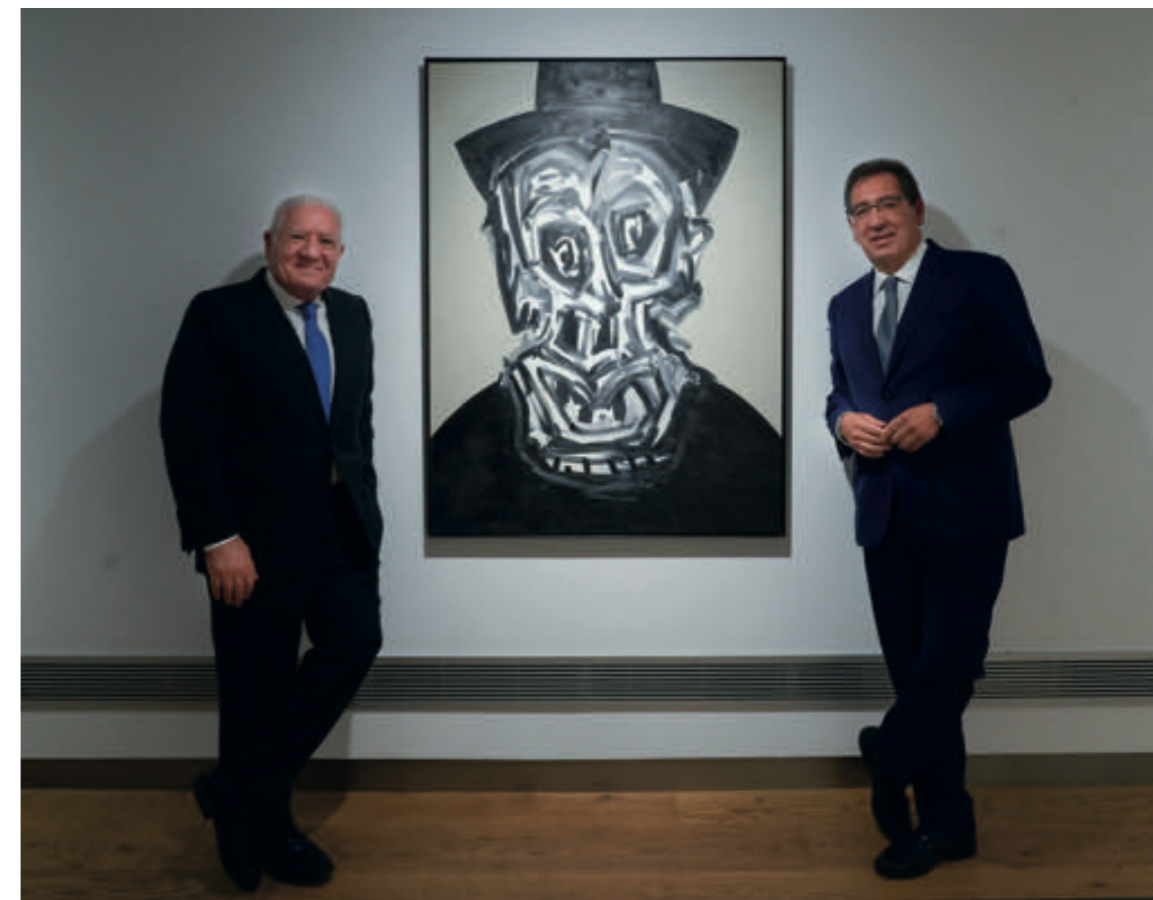
Superior El público sevillano no ha querido perderse la exposición de arte contemporáneo, una de las más visitadas en el tercer trimestre del año.