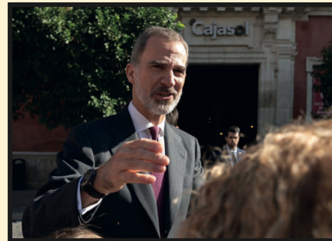
Felipe VI fue aclamado en todo momento por un público sevillano encantado de poder saludarle.

FELIPE VI: «EL CONGRESO HA CONTADO CON UNA AMPLÍSIMA AGENDA LITERARIA Y CULTURAL. EN LA QUE HAN PARTICIPADO MUCHOS DE LOS MEJORES ESCRITORES EN LENGUA ESPAÑOLA»