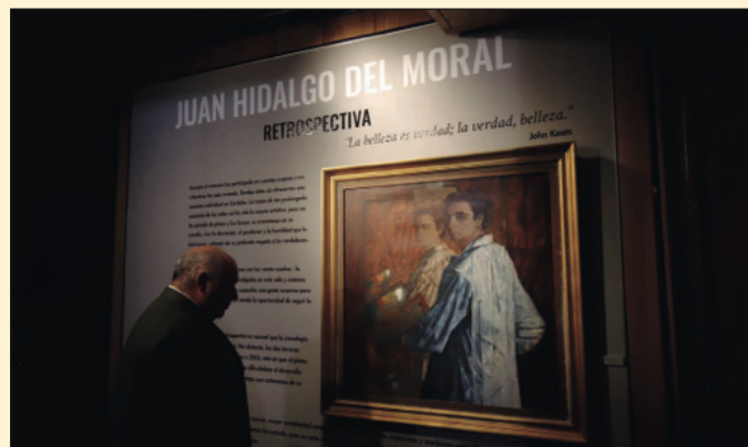
Exposición 'Juan Hidalgo del Moral. Retrospectiva'. Fundación Cajasol Córdoba.