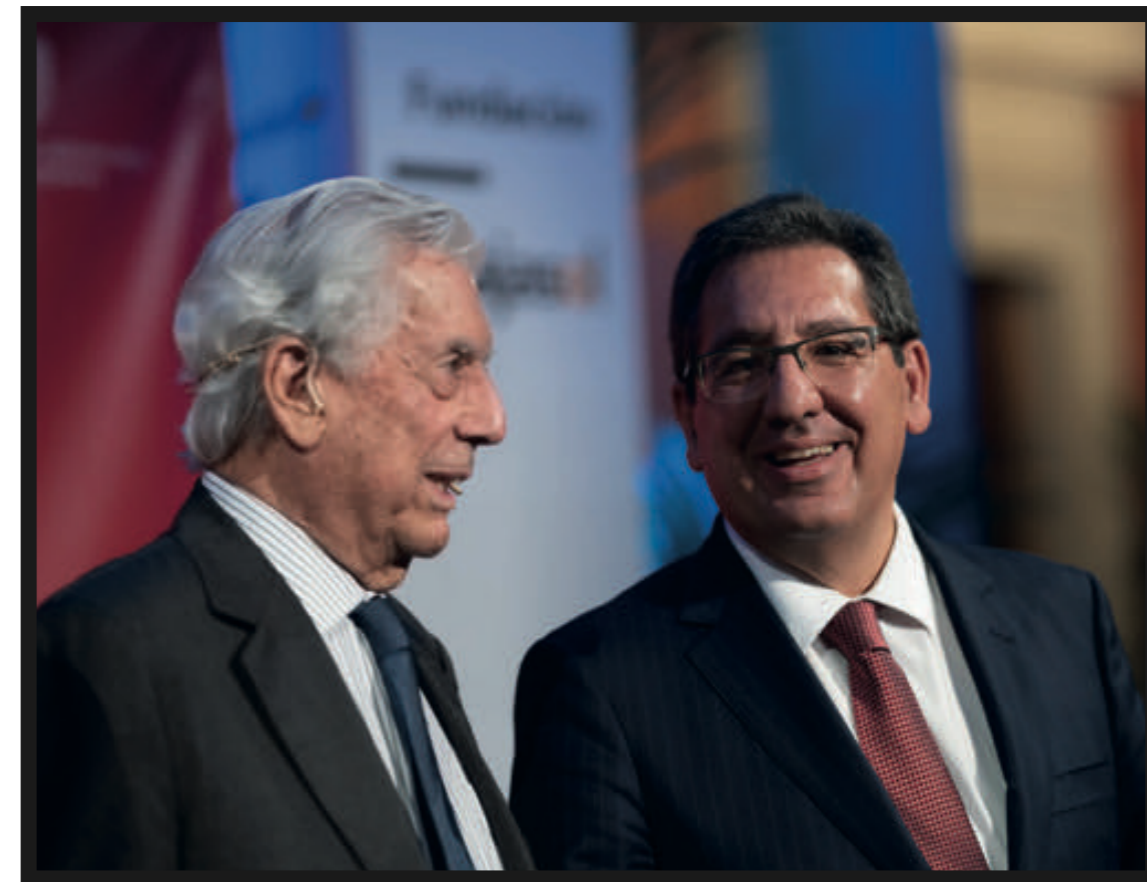
Mario Vargas Llosa y Antonio Pulido momentos antes del comienzo de su acto en el Patio Central de la Fundación Cajazol.

En la última parte del encuentro del Congreso ASALE, el escritor subrayó la idea de que si tuviera que elegir una única obra de todas las que ha escrito sería ‘Conversación en La Catedral’, y aunque, según Vargas Llosa, tuvo menos aceptación que otras, es de las que más ha crecido con el paso del tiempo.