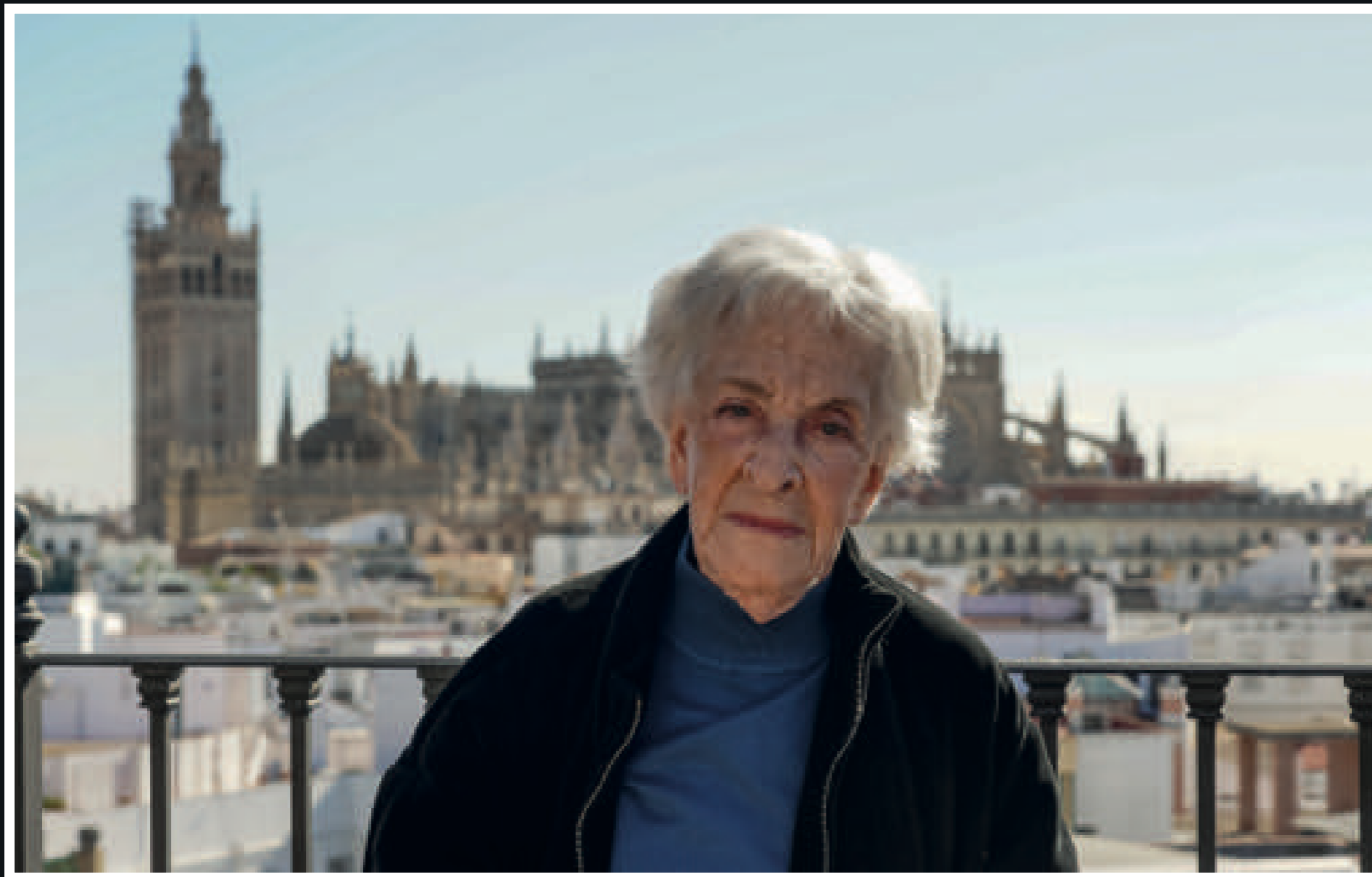
Ida Vitale ha sido este año Premio Cervantes 2018, uno de los mayores galardones que puede recibir un escritor.