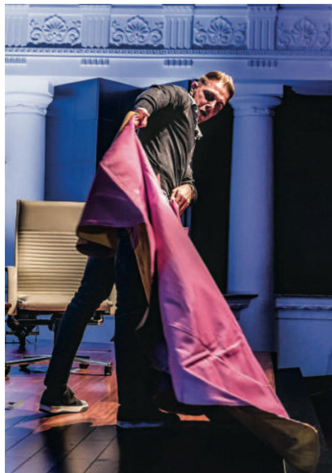
El futbolista Joaquín se atrevió con el capote durante la última edición del ciclo 'Mano a Mano'.