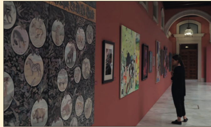
Exposición 'II Subasta a beneficio de Proyecto Hombre Sevilla'. Fundación Cajasol Sevilla.