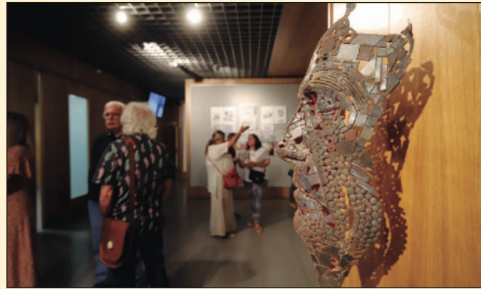
Exposición 'ART SUR 2019'. Fundación Cajasol Córdoba.