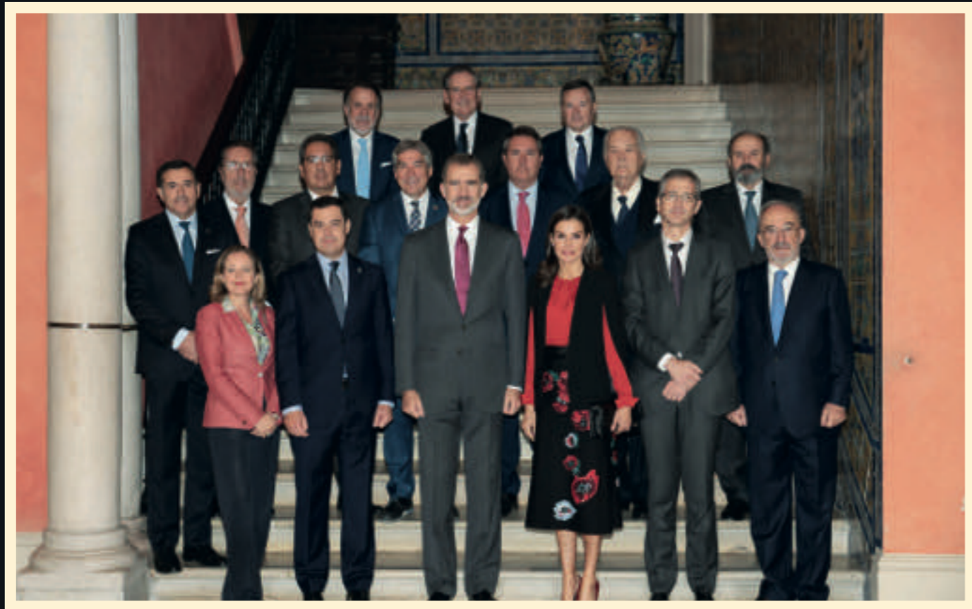
Foto de familia durante la visita de los reyes de España a la sede de la Fundación Cajasol en Sevilla.