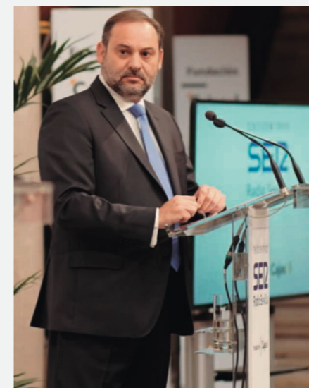
José Luis Ábalos, ministro de Fomento en Funciones, durante su intervención en los encuentros de la cadena SER, en la sede de la Fundación Cajasol en Sevilla.

El ministro de Fomento en funciones repasó la actualidad política del país en la cita de la emisora de radio en la Fundación Cajasol.