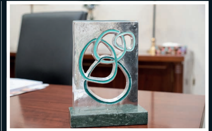
Galardón de los premios AFA 2020.

Recordemos que estos premios sirven para reconocer la contribución de las actividades de las fundaciones y asociaciones en su labor dentro de la sociedad, tanto de forma humana como empresarial