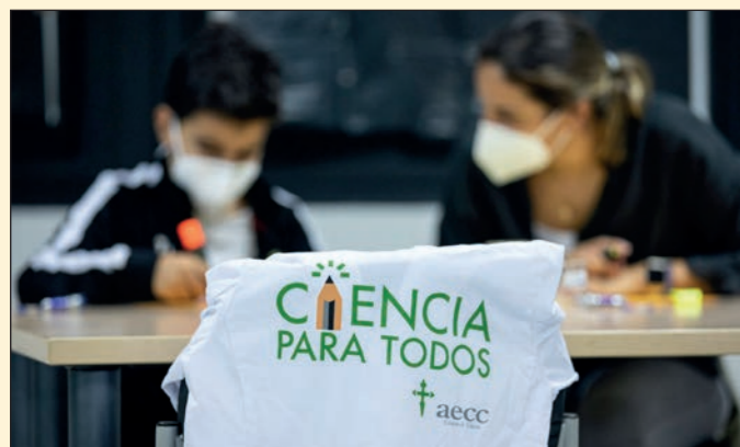
Ciclo 'Los viernes en familia' en Huelva: 'Ciencia para todos'. Fundación Cajasol Huelva.