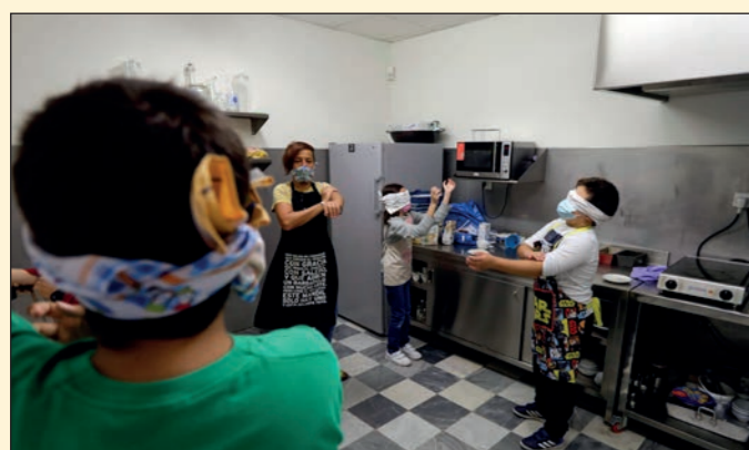
Ciclo "Taller de cocina" en Cádiz. Fundación Cajasol Cádiz.