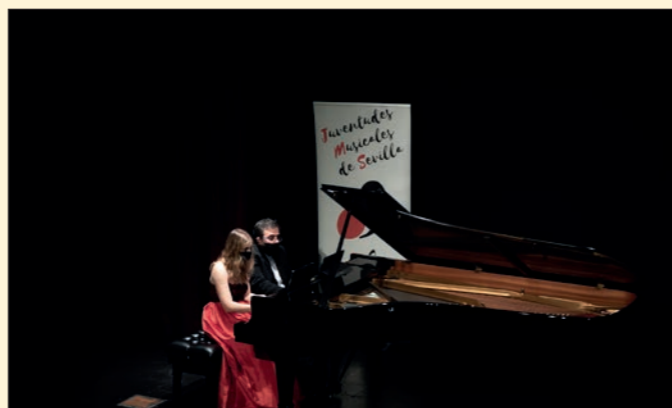
Ciclo 'Beethoven Sinfónico al Piano': IBERIAN & Klavier Piano Duo. Fundación Cajasol Sevilla.