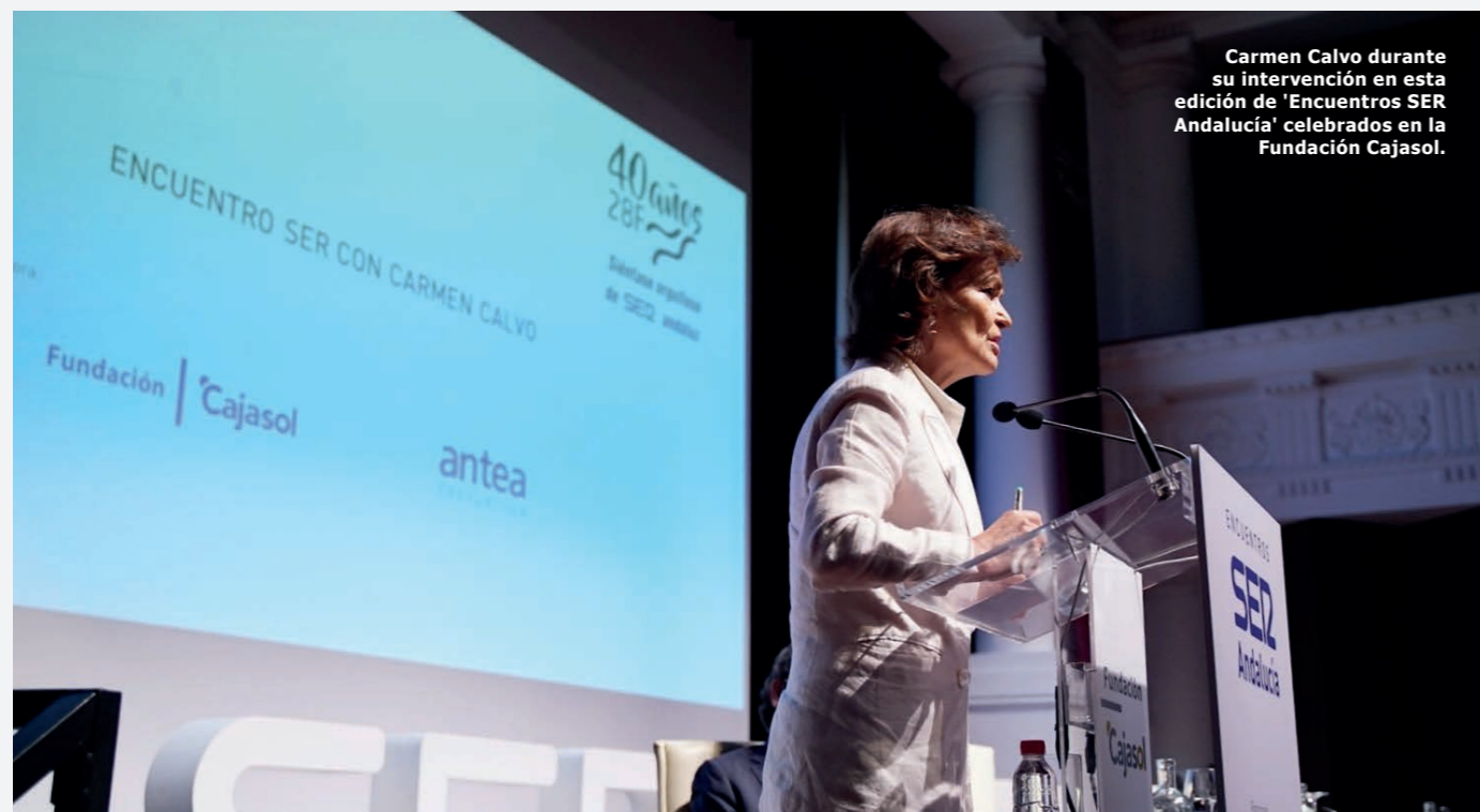
Carmen Calvo durante su intervención en esta edición de 'Encuentros SER Andalucía' celebrados en la Fundación Cajasol.