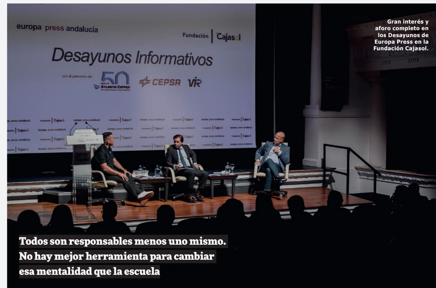
Gran interés y aforo completo en los Desayunos de Europa Press en la Fundación Cajasol.