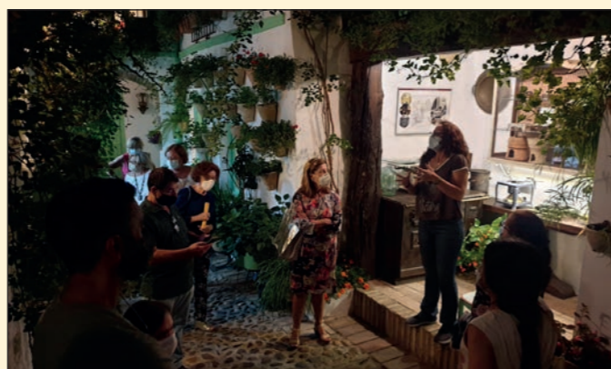
Ciclo "Taller de cata de flores y visita a patios cordobeses" en Córdoba. Fundación Cajasol Córdoba.