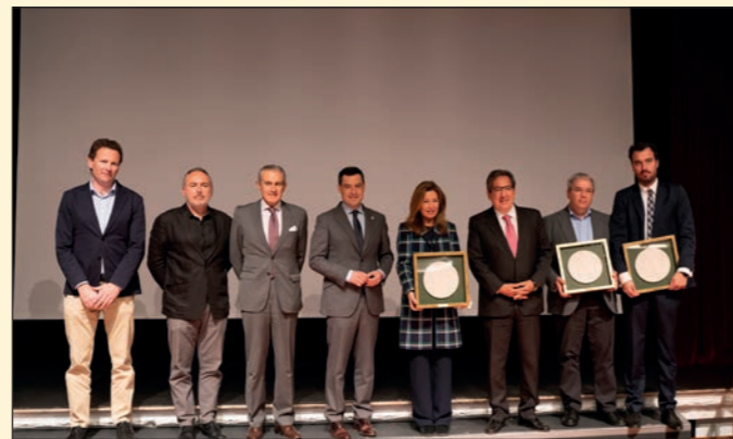
I Premios 'Andalucía hacia el futuro.' Fundación Cajazol Sevilla.