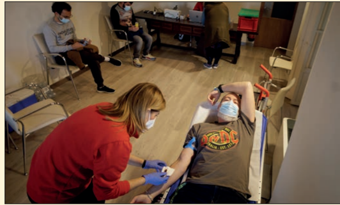
Campana de Donación de Sangre. Fundación Cajazol Cádiz.