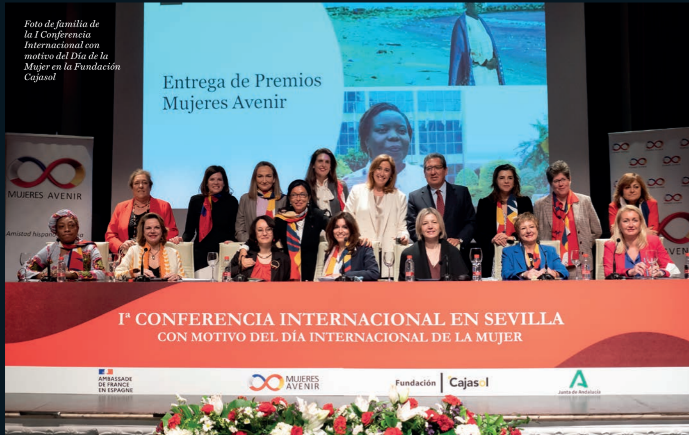
Foto de familia de la I Conferencia Internacional con motivo del Día de la Mujer en la Fundación Cajasol