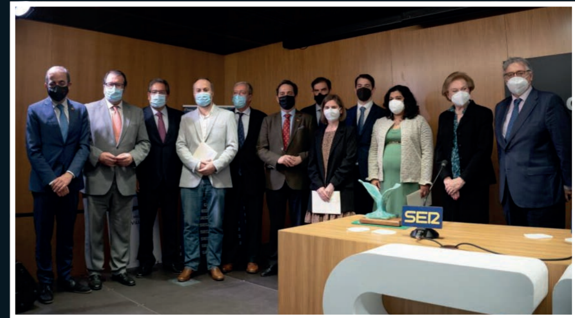
Foto de Familia durante la entrega de los IX Premios Losada Villasante en la Fundación Cajasol.

Tanto los griegos como los romanos utilizaron el símbolo de la balanza para identificar a la diosa de la justicia pues representaba la igualdad con la que todos los ciudadanos eran tratados. Actualmente la balanza representa simbólicamente la igualdad entre la ley y la justa medida que ha de tomar el juez.