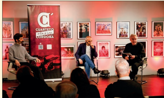
Coloquio-concierto 'Loving Mendelssohn.' Fundación Cajazol Córdoba.