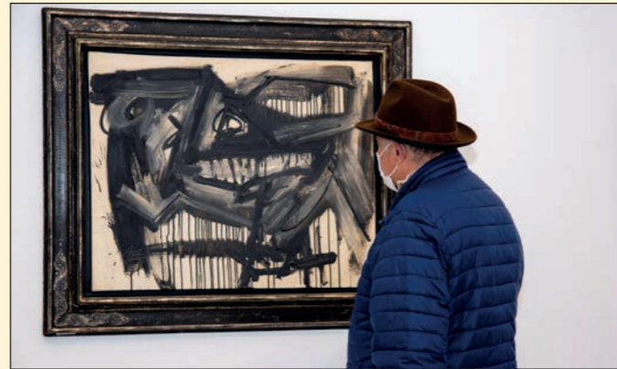
Exposición 'Cuadros para una colección.' Fundación Cajazol Huelva.