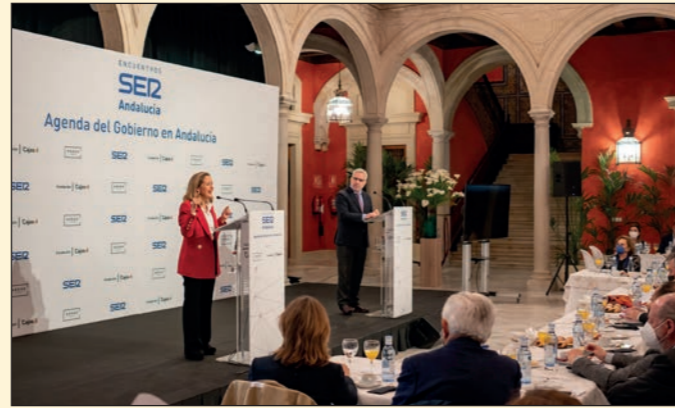
Ciclo 'Encuentros SER Agenda de Gobierno en Andalucía.' Fundación Cajazol Sevilla.