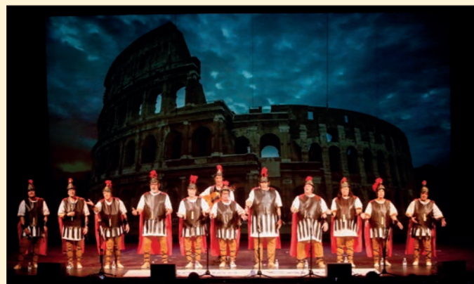
Fiesta de Carnaval de los Mayores. Fundación Cajazol Córdoba.