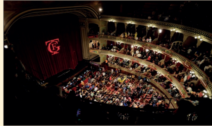
Final del COAC 2023. Gran Teatro Falla, Cádiz.