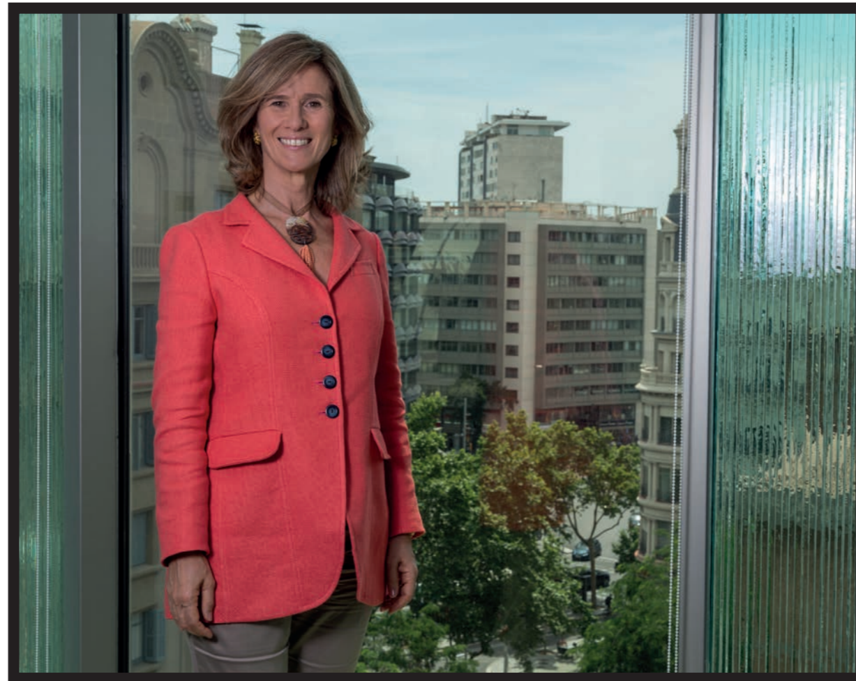
La Presidenta de Fundación COTEC, Cristina Garmendia, es una de las mayores expertas sobre innovación y desarrollo en España.

La Presidenta de la Fundación COTEC para la Innovación responde sobre la situación de nuestro país en el ámbito del I+D+I y el futuro en este ámbito. Todo ello tras la visita de la ex ministra a la Fundación Cajazol.