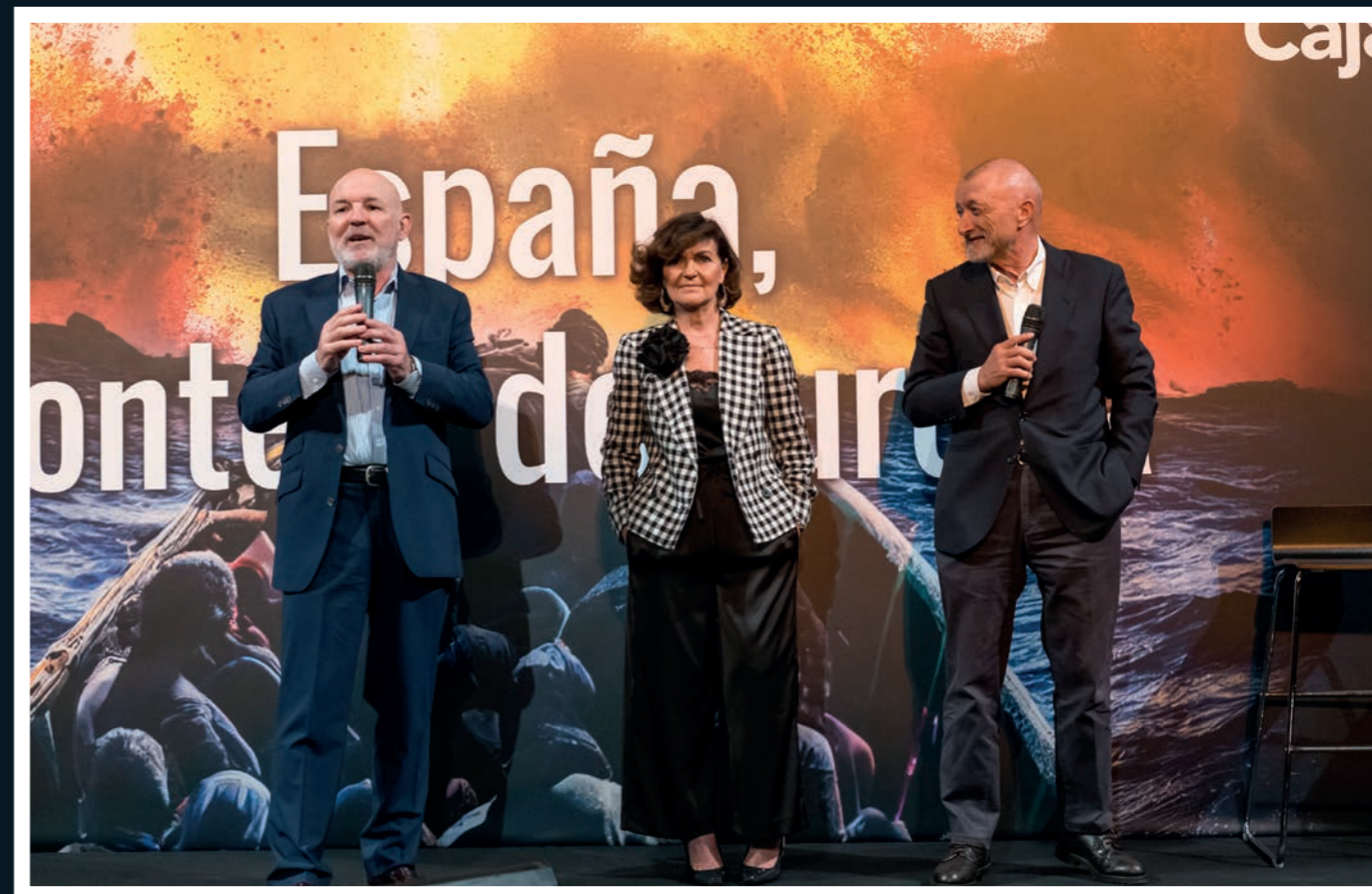
Jesús Vigorra y Arturo Pérez-Reverte junto a Carmen Calvo en una de las jornadas.

En resumen, Letras en Sevilla VIII ha vuelto a ser un espacio de diálogo y reflexión que ha abordado el desafío migratorio en Europa desde distintas perspectivas. Las causas, los desafíos, la diversidad de los migrantes y las propuestas de solución han sido temas centrales en las tres jornadas del evento.