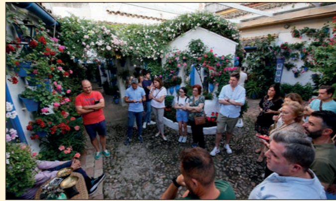
Taller de flores comestibles y visitas a Patios. Fundación Cajasol Córdoba.