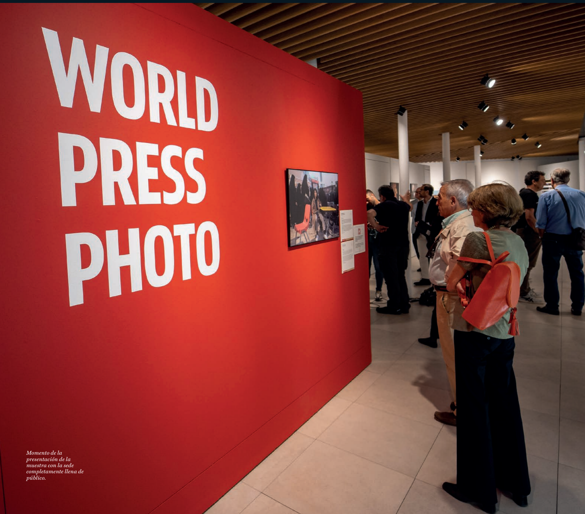
Momento de la presentación de la muestra con la sede completamente llena de público.