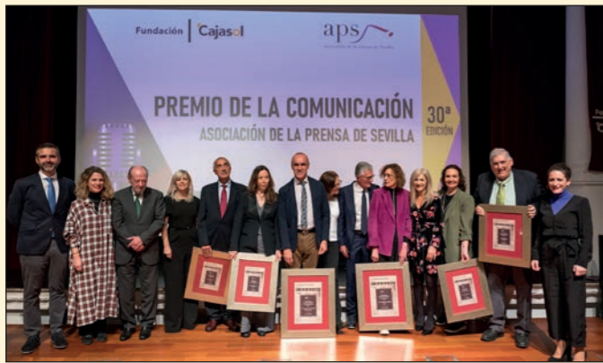
XXX Premio de la Comunicación de la Asociación de la Prensa de Sevilla. Fundación Cajasol Sevilla.