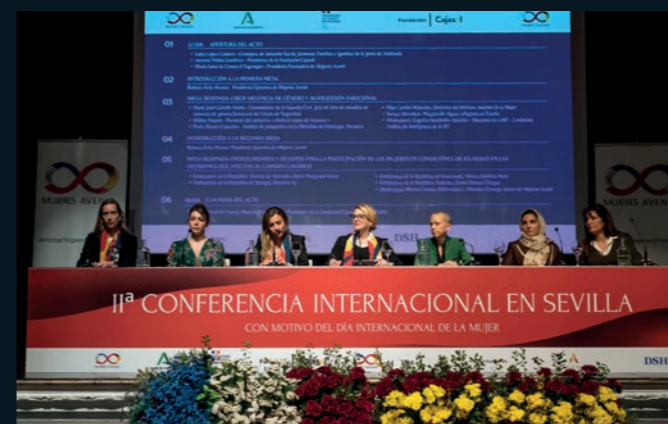
Inferior derecha Este acto celebrado en la Fundación Cajasol dio voz a las situaciones de muchas mujeres.