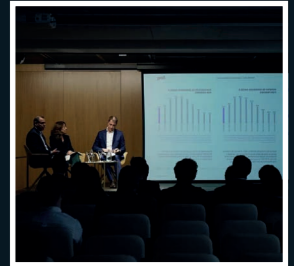
Instantes de la presentación del Informe de la Fundación COTEC en la Fundación Cajasol.