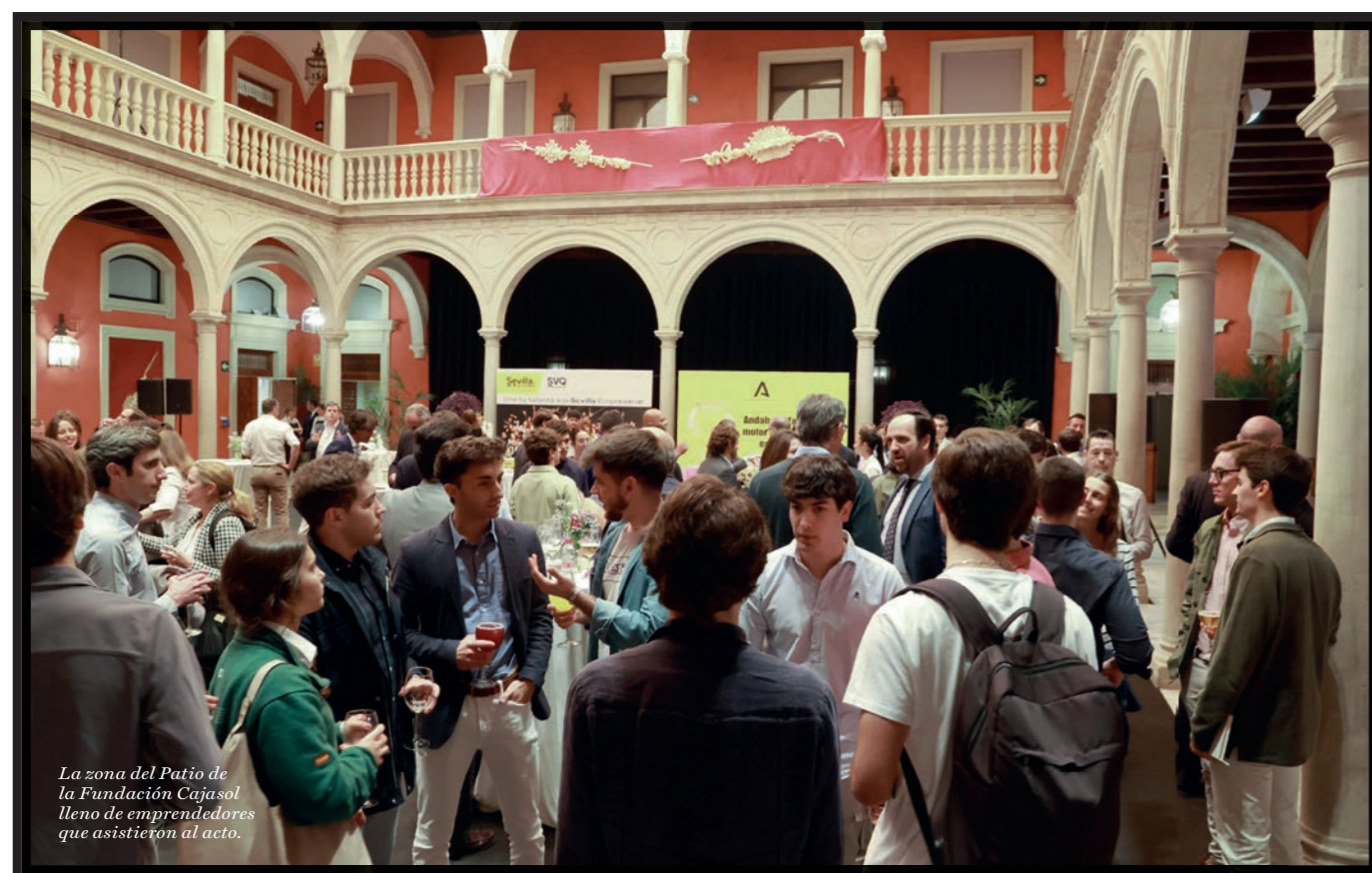
La zona del Patio de la Fundación Cajasol lleno de emprendedores que asistieron al acto.

EL ECOSISTEMA EMPRENDEDOR EN ANDALUCÍA está en auge, y así quedó reflejado en el evento 'Zona Startups 2023'. Organizado por el Instituto de Estudios Cajasol, esta iniciativa ha conseguido reunir a las principales entidades promotoras del emprendimiento andaluz, como la Fundación Andalucía Emprende, SVQ Emprende, Andalucía Open Future, Programa Minerva, Sputnik, la Fábrica de Sevilla, Sevilla Up, Corporación Tecnológica de Andalucía y Confederación de Empresarios de Andalucía y Espacio RES. En torno a ellas, más de 200 emprendedores, inversores y expertos han podido debatir y analizar aspectos relevantes a la hora de desarrollar un proyecto empresarial.