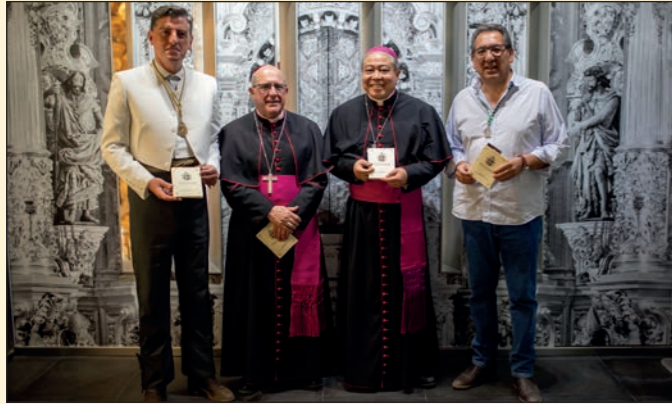
Presentación del libro 'El Rocío visto por el Papa' en el Museo del Santuario, El Rocío, Huelva.