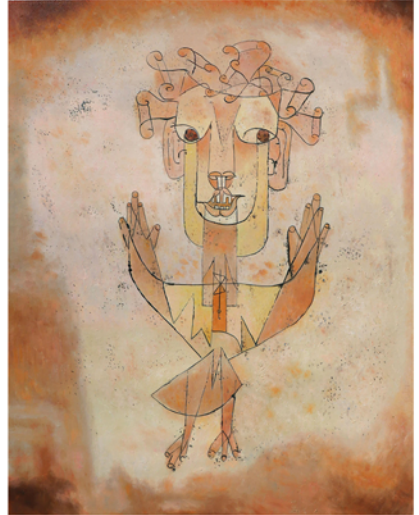
Angelus Novus , obra de Paul Klee adquirida por Walter Benjamin en 1921.

Del mismo modo, la vida de Cristo, el hijo de Dios, que ilumina la verdad con su falta de presencia, caminando voluntariamente hacia una muerte injusta servida en bandeja por los suyos, tiene mucho que ver con la propuesta de la activista política francesa, Weil, que se hace desaparecer echándose a la “muerte” que amplifica el rumor de lo infinito, y cuya falta de protagonismo encontramos también en el concepto de Idea de Benjamin, como unción religiosa del lenguaje nuevo, limpio de la arbitrariedad aséptica en el uso funcional y desactualizado.